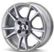
Диск Véléno 16" 9607 W8*