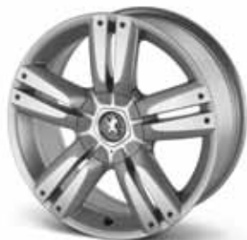
Диск Oxalis 18" 9607 S1