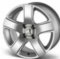
Диск Isara 16" 5402 Y4*