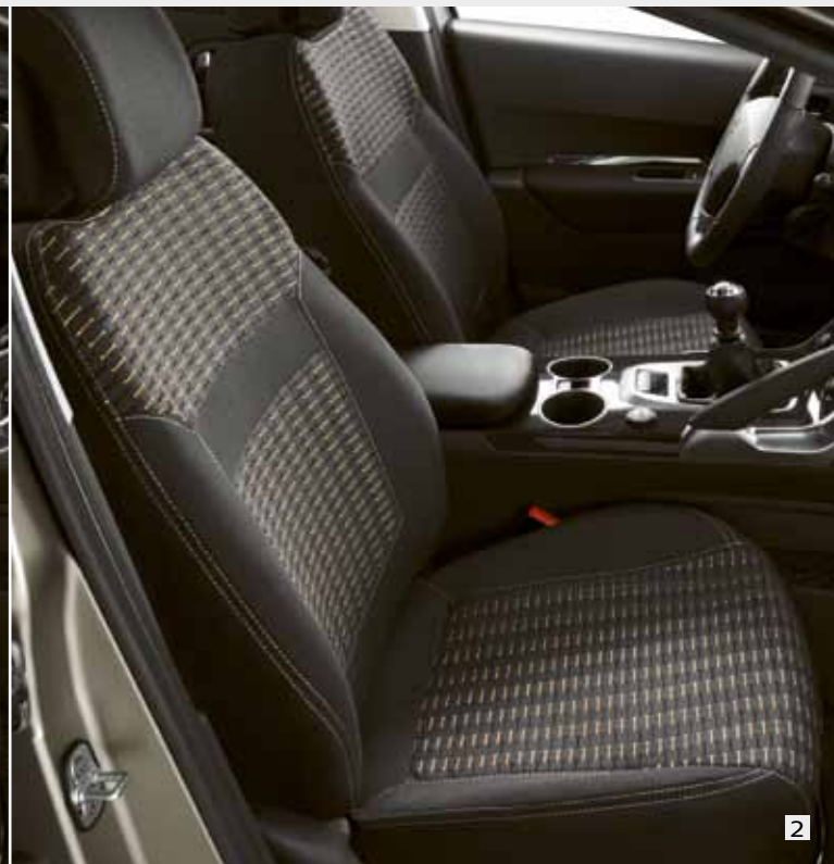
2 Чехлы сидений Venise 9669 X8

Оба вида чехлов безупречно сочетаются со стилем интерьера. Чехлы можно использовать для сидений со встроенными боковыми подушками безопасности.