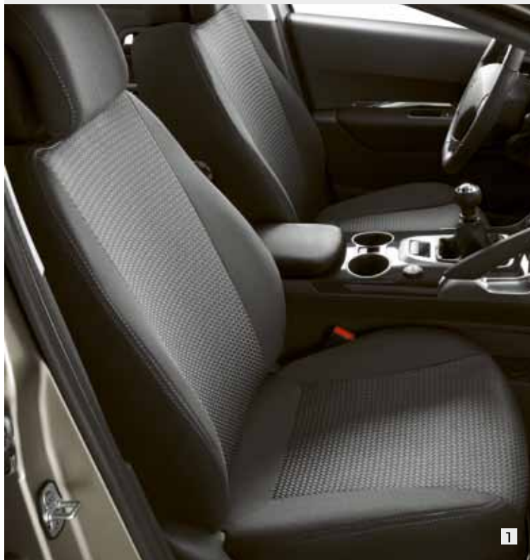
1 Чехлы сидений Brasilia 9669 X7

Салон вашего 3008 — ваше жизненное пространство. Сделайте его еще более практичным, комфортабельным и красивым с помощью аксессуаров, созданных специально для того, чтобы превращать поездки в удовольствие.