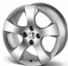
Диск Savara 17" 5402 Y5*