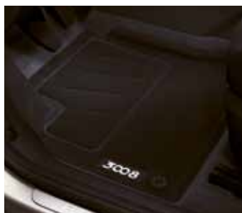
Комплект рельефных ковриков 9663 E1