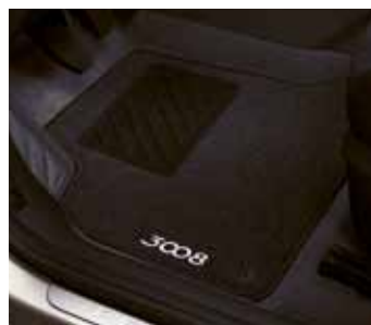
Комплект тканевых ворсистых ковриков 9663 C8