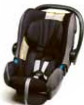
Romer Baby Safe + Категория: 0+ 9648 E8

Предлагается ассортимент сидений, обеспечивающих оптимальный комфорт при перевозке детей (от новорожденных до детей массой 36 кг). Сиденья протестированы и одобрены в соответствии с самыми строгими стандартами безопасности (Европейский сертификат ECE R44 / 03).