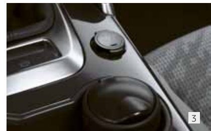
3 Съемная пепельница 7589 05 Прикуриватель (алюминий) 8227 96

Оба вида чехлов безупречно сочетаются со стилем интерьера. Чехлы можно использовать для сидений со встроенными боковыми подушками безопасности.