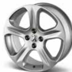
Диск Exopa 18" 5402 Z1*