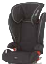
Romer Kidfix Категория: 2, 3 9448 18