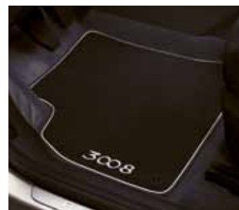
Комплект велюровых ковриков с кантом 9663 E2