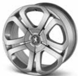
Диск Galium 17" R9607 S0