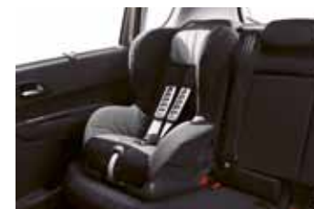
Romer Duo + (с 3-точечными креплениями Isofix) Категория: 1 9448 15