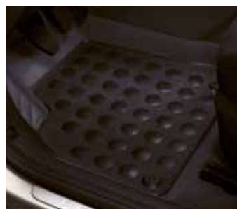
Комплект резиновых ковриков 9663 E5 — набор передних ковриков 9663 G3 — набор задних ковриков D000000036 — комплект задних и передних ковриков с бортами