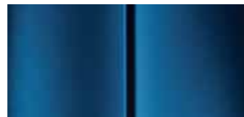
Синяя (Bleu Cyanos)