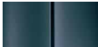
Серая (Gris Fer)