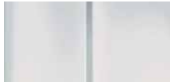
Белая (Blanc Banquise)