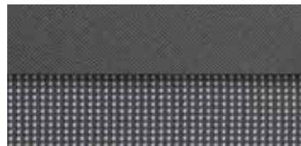
Обивка Transcodage (для двухместной конфигурации)