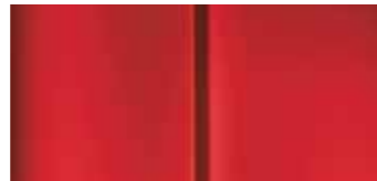
Красная (Rouge Ardent)