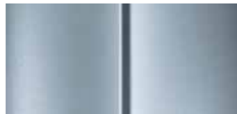
Серая (Gris Aluminium)